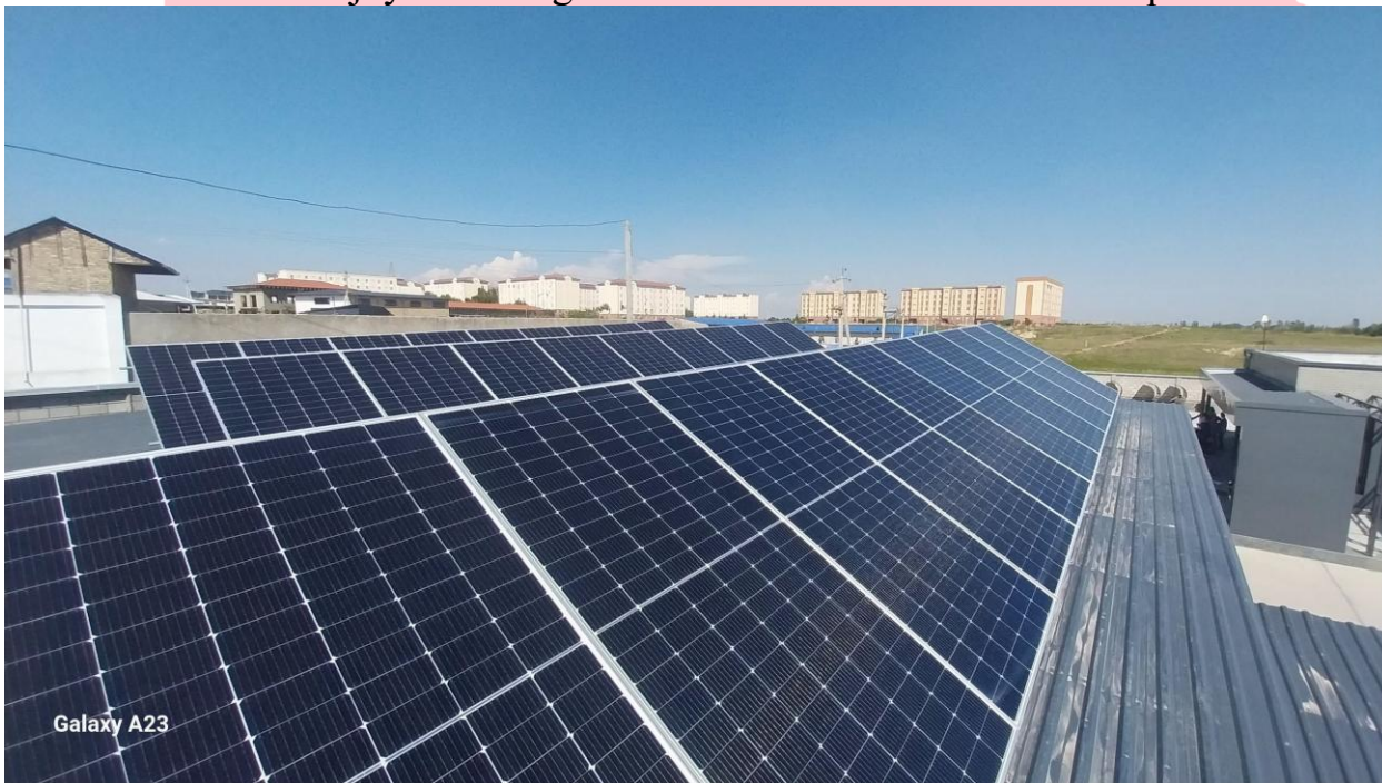
1-rasm Namangan viloyatidagi imtihon markaziga o‘rnatilgan fotoelektrik stansiya.

Men fotoelektrik stansiyaning loyihalash jarayonini boshlashdan oldin eng muhim bosqichlardan biri bo‘lgan dastlabki tahlil va energiya ehtiyojini aniqlashga alohida e’tibor qarataman. Chunki aynan shu bosqich kelajakdagi tizimning qanchalik samarali ishlashini belgilab beradi. Agar bu yerda xatoga yo‘l qo‘yilsa,